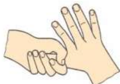
5. Trenie palca pravej ruky ľavou rukou a naopak ľavej ruky a naopak