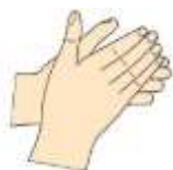
1. Dľaň ku dlani

* Štandardný postup drhnutia rúk (opakujte každý krok 5 krát)