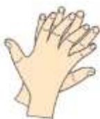
2. Dľaň pravej ruky cez vrchnú časť ľavej a opačne